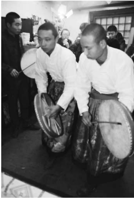
図5 満族 シャーマンの太鼓