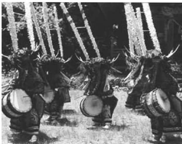
図11 金津流丹内鹿子躍