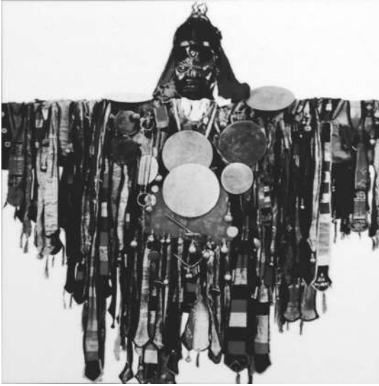
図8 満族のシャーマン