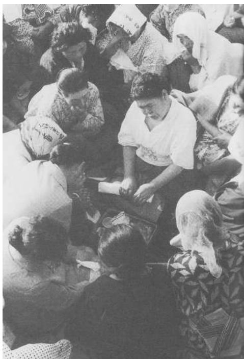
図12 イタコの口寄せに耳をかたむける人たち（青森県むつ市）