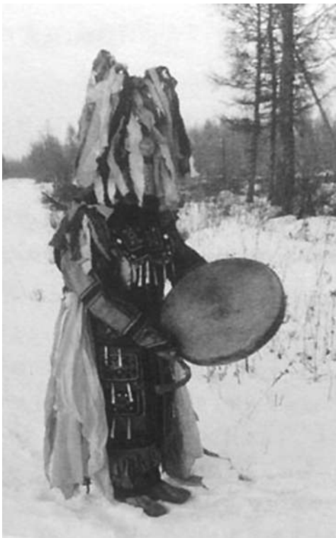
図9 鹿に扮して太鼓をたたく満族のシャーマン