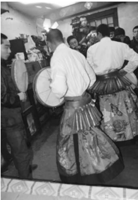
図7 満族 シャーマンのベルトベル