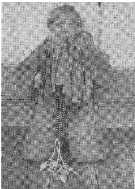
図13 巫女とオシラサマ（宮城県北部）