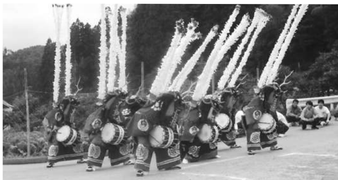
図10 春日流八幡鹿踊り

シベリアのシャーマンは太鼓を用い、鹿類（トナカイかノロジカ）に扮するか、猛禽類に扮するかのどちらかであるが、日本海を隔てた対岸の沿海州からバイカル湖にかけての地域のツングース系諸族は、シャーマンの装束としてシカ類と鳥類の重なったところである。したがって、鹿の頭をいただき、背には羽根状の腰差をさす姿は、沿海州からバイカル湖にかけてのシャーマンの影響を受けたものと考えられるという（大林、1991、pp.158-161）。