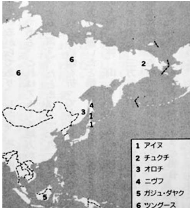
図1：ツングース系民族の分布図