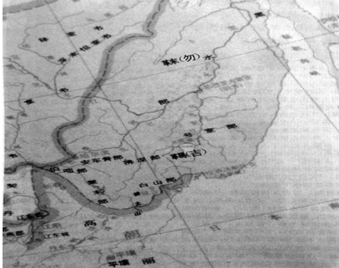
図3：歴史上のツングース系民族の分布状況（勿吉-靺鞨）