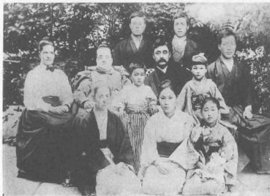
1897年(明治30年頃) (中央)若き日の札幌農学校教授(現北大)新渡戸稲造と(その左)妻メアリー。前列右から2人目河井道子。

いじめ問題、人権が問われる今日こそ、聖書的人間観を真剣に見直す時であると思う。1996年4月23日共立基督教研究所に於いて「キリスト教女子教育と近代日本文化」について行った研