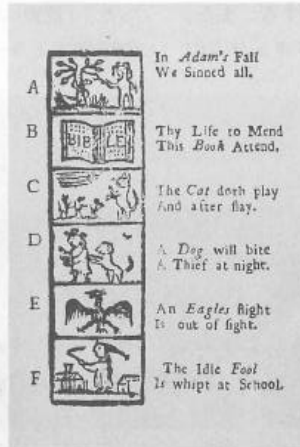
New England Primer （アルファベットと教義を教える為に用いられた）

政治的ラディカルなユダヤ系家庭に育ち、カナダからアメリカへとわたってきた移民である出自をししばしば強調するパーコヴィッチは、アメリカのピューリタニズムを外部者の視点で、イデオロギー的に分析しようと試みる。 8) 「アメリカ的自己のピューリタンの起源」（ The Puritan Origins of the American Self , 1975）と、まさにタイトルからして意図的にアメリカ人のアイデンティティをピューリタニズムに遡ろうとするパーコヴィッチの打ち出すピューリタン像は、ミラーの提示した一枚岩的なピューリタン認識をより増強している。ピューリタンの荒野での「使命（errand）」をアメリカの国家的使命に発展させて解釈する点でもミラーを継承する。こうしたパーコヴィッチのピューリタン解釈に対する他の研究者からの批判は絶えないが、